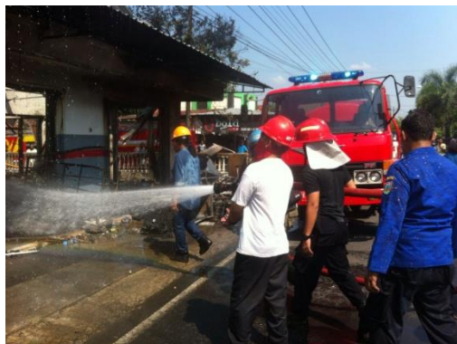
Kebakaran bangunan/ tempat usaha pertamini di Ds. Loram Wetan Kec. Jati tanggal 14 Juni 2018