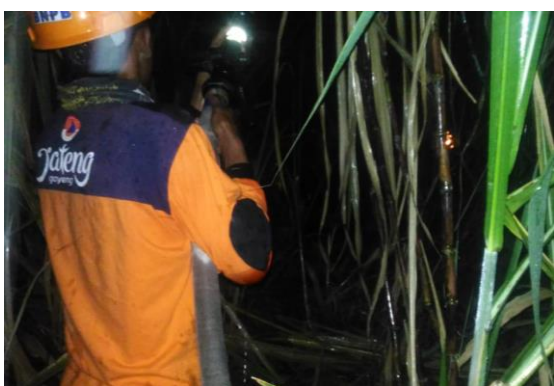
Kebakaran lahan tebu di Ds. Besito Kec. Gebog tanggal 14 Juni 2017