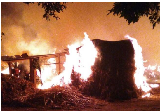
Kebakaran gudang produksi gula merah di Ds. Piji Kec. Dawe tanggal 10 Juni 2018