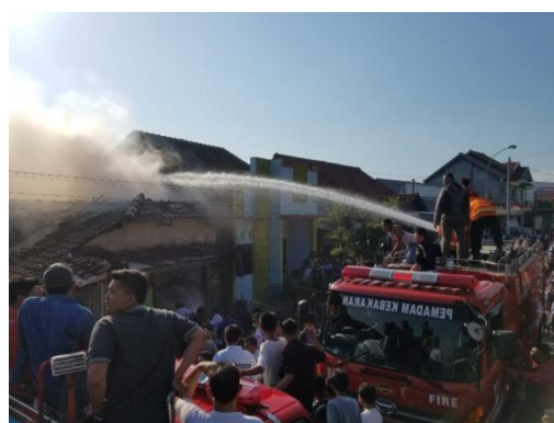
Kebakaran bangunan rumah dan bengkel di Ds. Loram Wetan Kec. Jati tanggal 17 Juni 2018