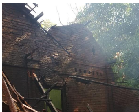
Kebakaran Bangunan dapur di Ds. Klumpit 1/8 Kec. Gebog tanggal 27 Juni 2018